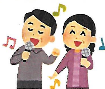
楽しいレクリエーション