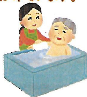
安心・安全にご入浴