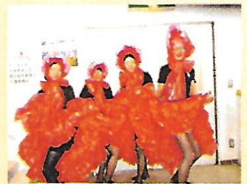
ゆかいなスタッフ